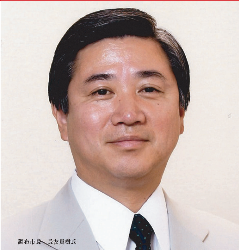
調布市長 長友貴樹氏